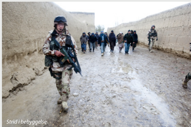
Strid i bebyggelse

”Taktik är konsten att medvetet välja... medel och metoder i en given situation