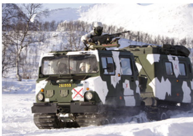
Cold Respons är den största vinterövningen som svenska Försvarsmakten deltar i 2012.