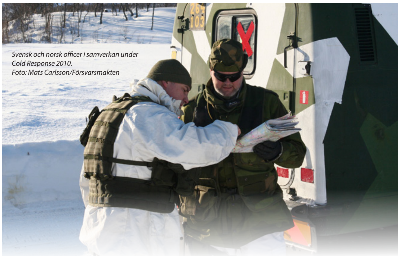
Svensk och norsk officer i samverkan under Cold Response 2010.