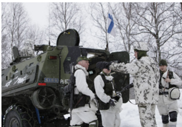
Svenska och finska soldater i samverkan under Cold Response 2009.