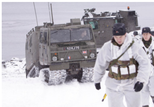
Brittiska marinkårssoldater landstiger under Cold Response 2010.