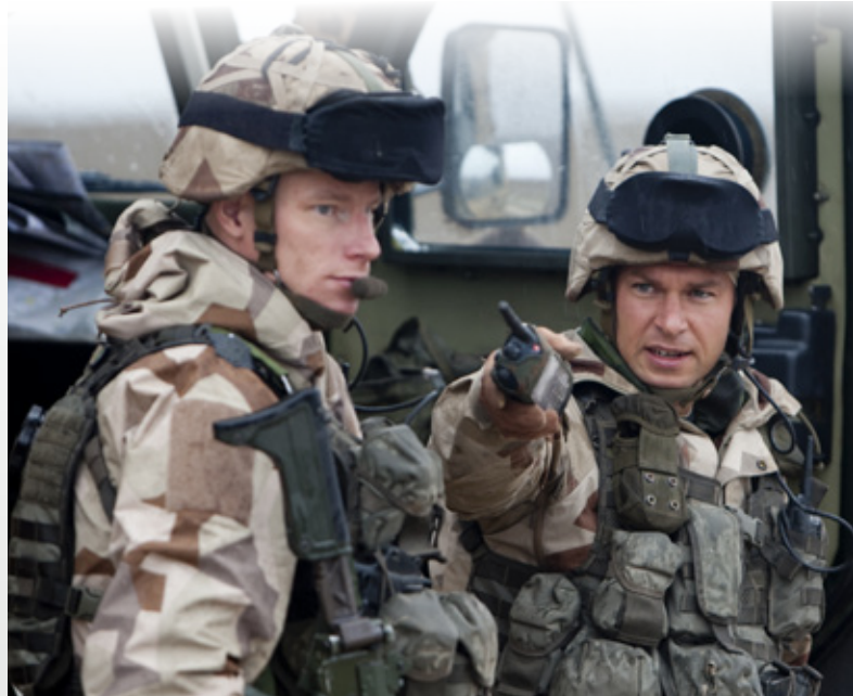
Bild från Afghanistan där chefen leder verksamhet

MSR 2:2 Befäl i fält ska ge vägledning för hur våra chefer bör agera som befäl i olika nivåer under fältförhållanden. Befäl i fält riktas till befäl, lärare och befälselever på alla nivåer och kommer att i huvudsak